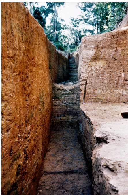
Figura 2 – Trincheira de inspeção escavada manualmente em solo de alteração de micaxisto.